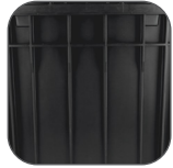
Diseño de costillas reforzado.