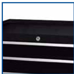
Sistema de seguridad general de alta seguridad.