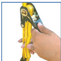
Dispositivo de tensión por medio de matraca.