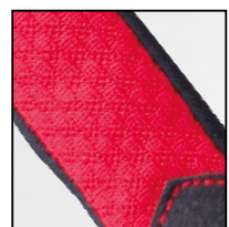
Tejido elástico para mayor transpiración y ergonomía.

Palma Rellena de espuma de gel que reduce los impactos y la vibración.