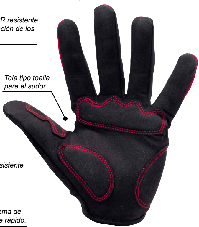
Banda con sistema de apertura y cierre rápido.