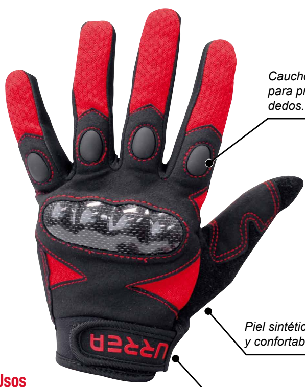
Caucho TPR resistente para protección de los dedos.

Palma Rellena de espuma de gel que reduce los impactos y la vibración.