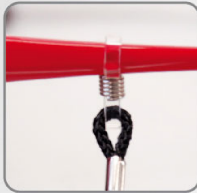
Cordón de nylon ajustable a las patas.