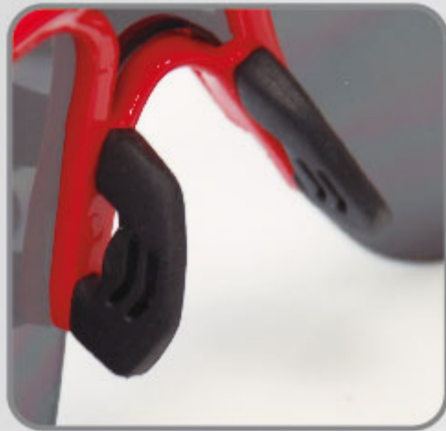
Soporte de Nariz de hule suave anti-derrapante.