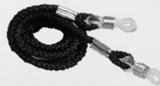
Incluye: cordón de nylon