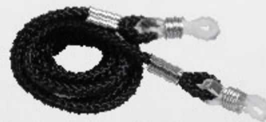
Incluye: cordón de nylon