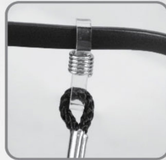
Cordón de nylon ajustable a las patas.