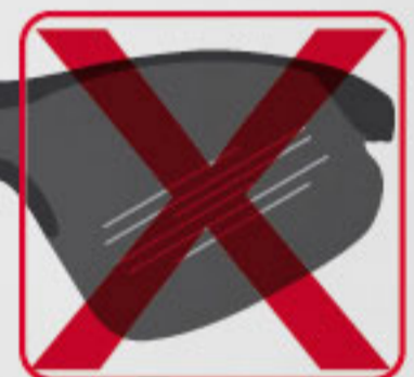
Mica de policarbonato inyectado, prismado para reflejar y refractar la luz con tratamiento anti-UV.