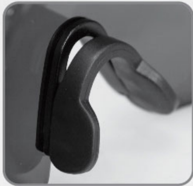
Soporte de Nariz de hule suave anti-derrapante.