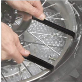
Barra para montar y desmontar llantas de motocicletas