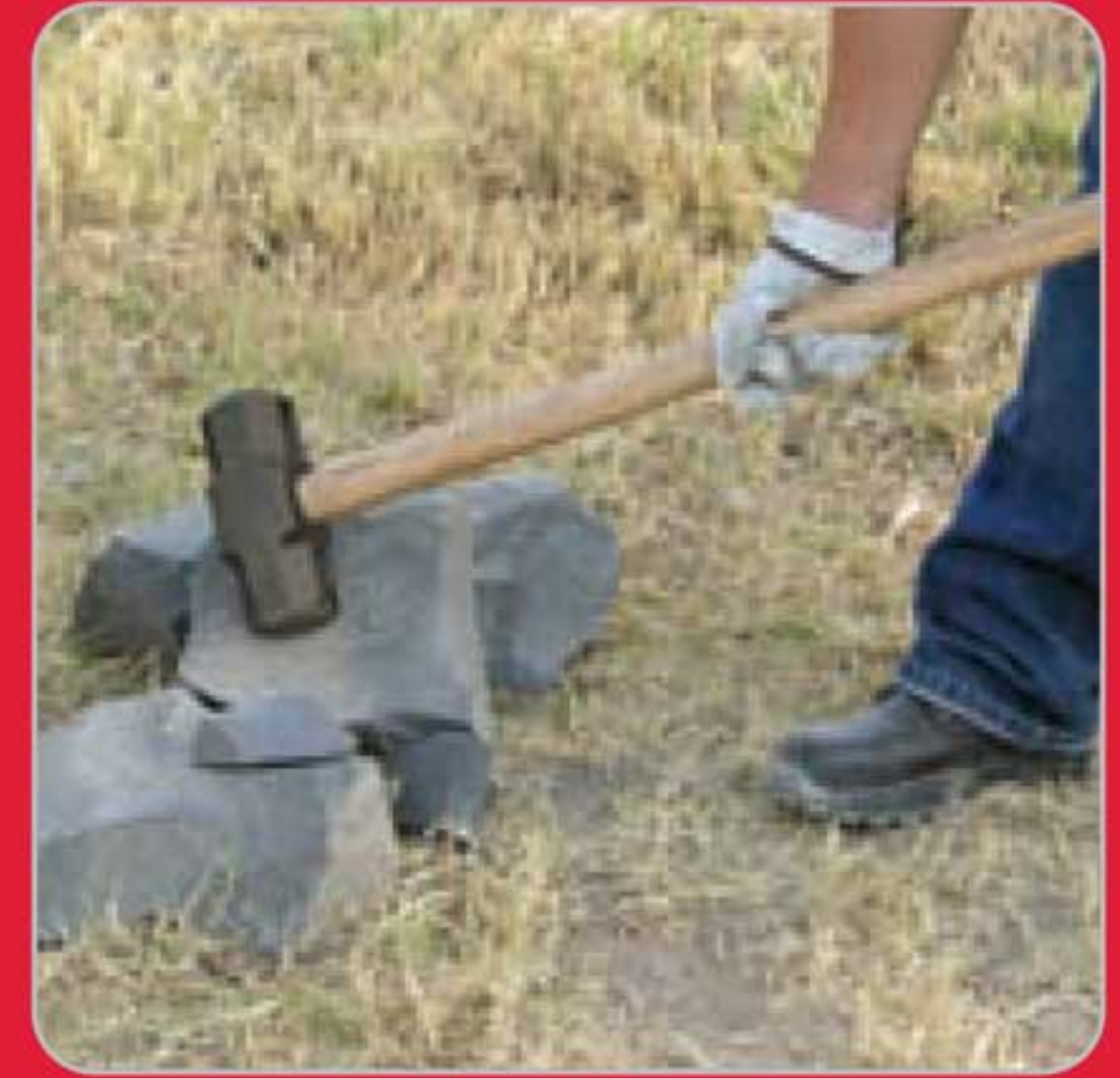
• Romper piedra