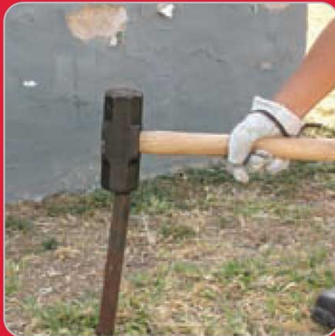
Golpear y fijar