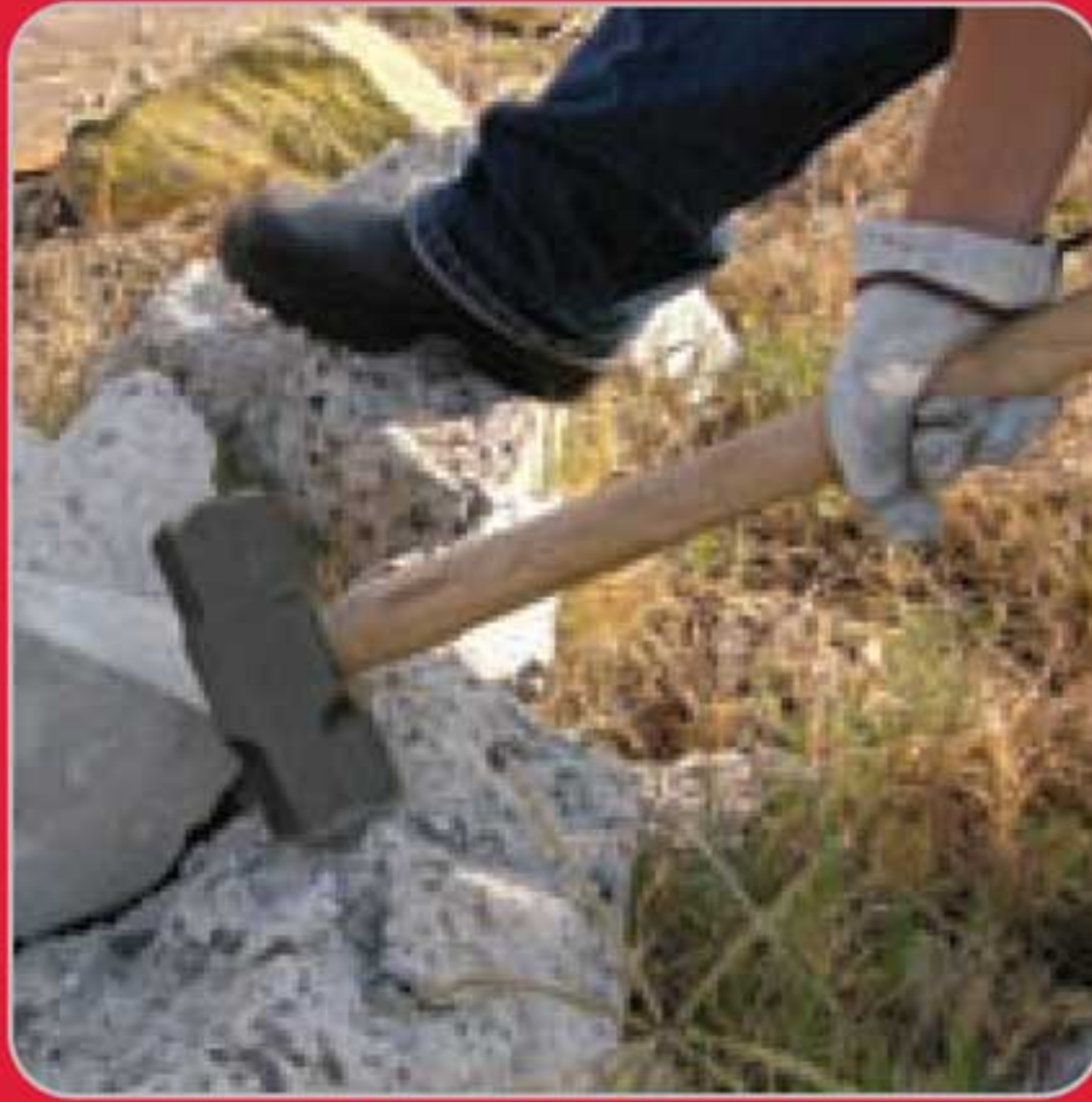
• Demoler concreto